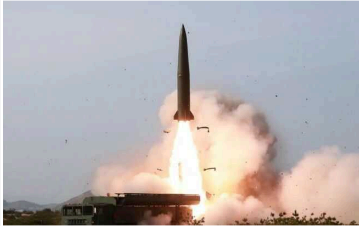
NYT: РФ отримала нові поставки балістичних ракет від Північної Кореї

Росія отримала нові постачання балістичних ракет малої дальності Hwasong-11 від Північної Кореї. Окупанти вже використовували їх для атак на Київ цього літа.