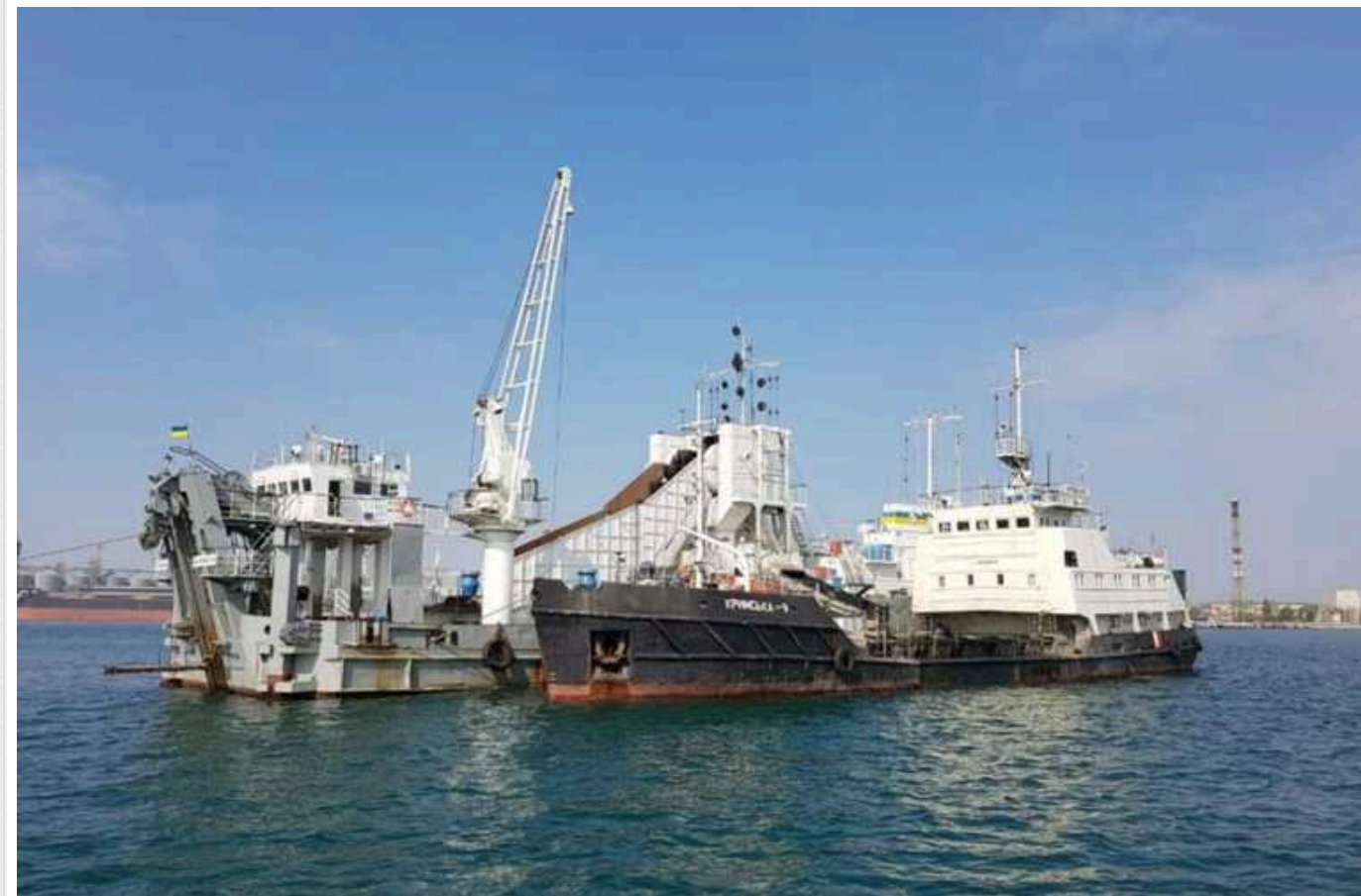
АМПУ планує витратити 310 мільйонів гривень на судно з баржею

Південна філія державного підприємства «Адміністрація морських портів України» оголосила тендер на придбання багатofункціонального судна в комплекті з несамохідною баржею з очікуваною вартістю 310 млн гривень (без ПДВ).