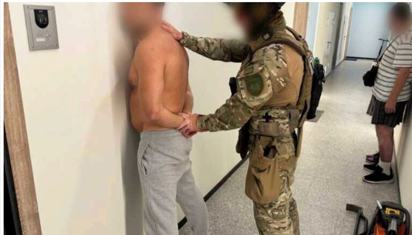
У Тернополі керівник відділення «Укрпошти» привласнив квадрокоптери

У Тернополі керівник відділення «Укрпошти» спільно з підлеглими організував масштабну схему привласнення безпілотних літальних апаратів, призначених для військових. Загальна вартість викрадених квадрокоптерів становить майже 6 мільйонів гривень.