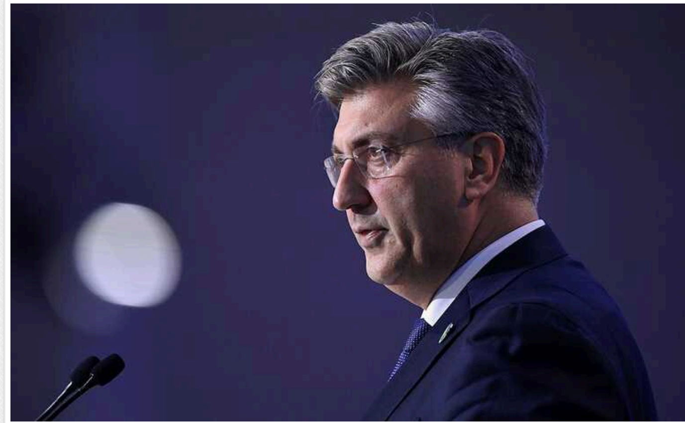
Прем'єр Хорватії оголосив про новий пакет військової допомоги для України

Прем'єр-міністр Хорватії Андрей Пленкович під час свого візиту до Києва 11 вересня оголосив про новий пакет військової допомоги Україні.