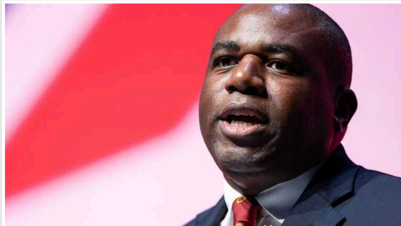
Глава МЗС Британії оголосив про новий пакет допомоги Україні на суму понад 600 мільйонів фунтів

Велика Британія оголосила про виділення не менше 242 млн фунтів стерлінгів на підтримку України в умовах постійних російських атак, а також про розгортання 484 млн доларів фінансової допомоги та постачання військового обладнання.