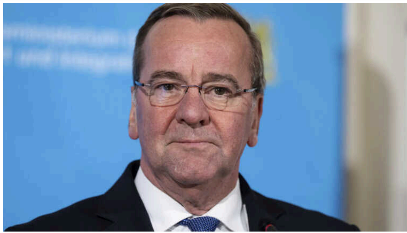
Росія зможе напасти на країну НАТО за кілька років, - Пісторіус

Росія орієнтується на військову економіку і, ймовірно, вже за кілька років зможе атакувати країни НАТО.