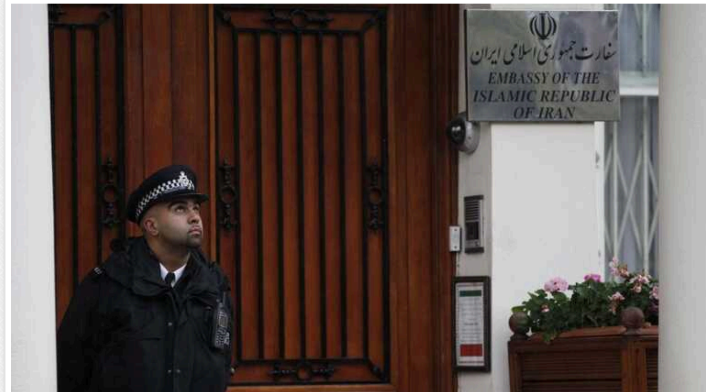
Британія викликала іранського дипломата в зв'язку з постачанням балістичних ракет Росії

У середу, 11 вересня, британське Міністерство закордонних справ викликала тимчасового повіреного в справах Ірану через передачу іранських балістичних ракет Росії.