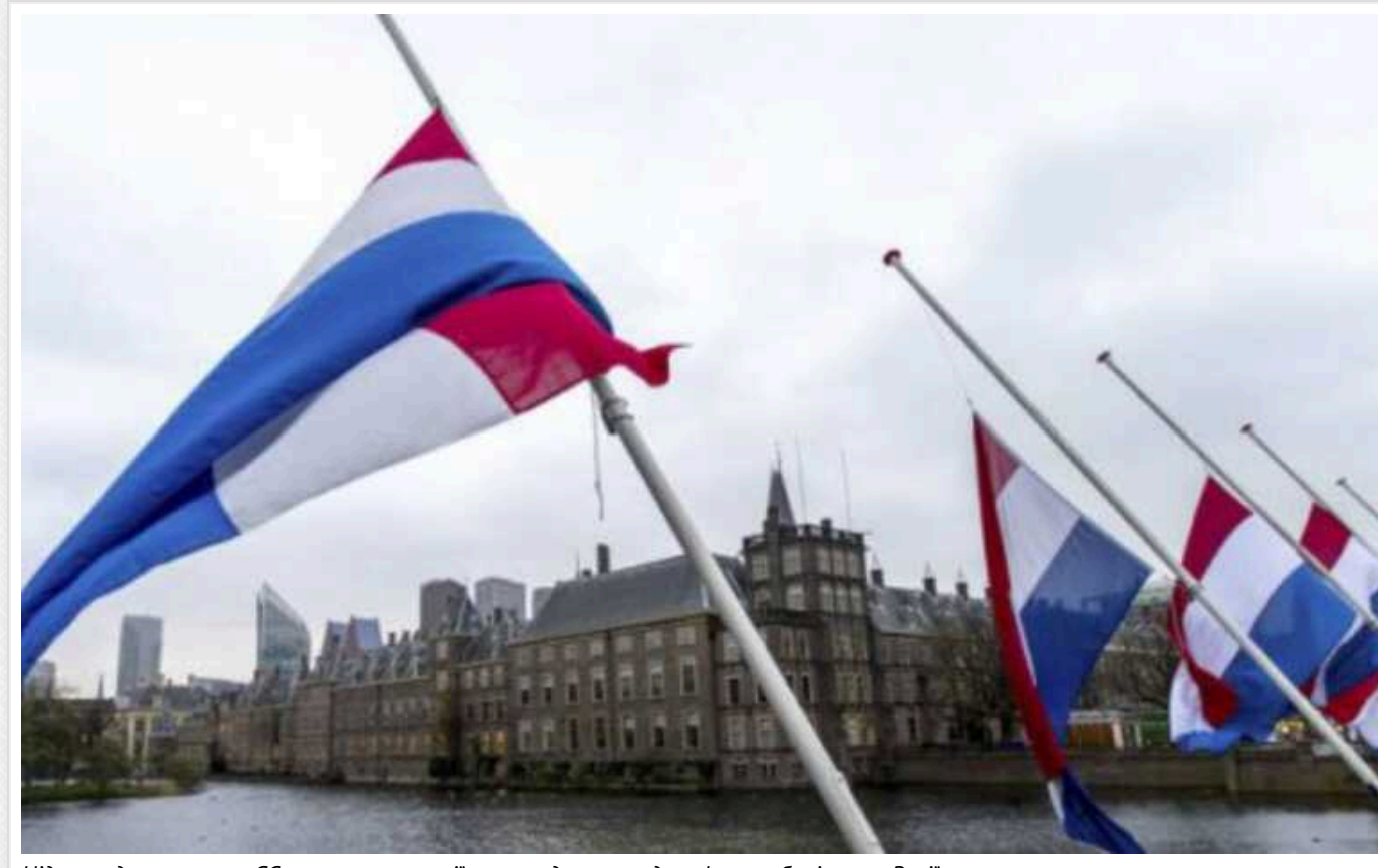
Нідерланди закликали ЄС посилити санкції та засудили передачу Іраном балістики Росії

Нідерланди засудили постачання балістичних ракет Іраном до Росії та закликали до посилення санкцій з боку Європейського Союзу.