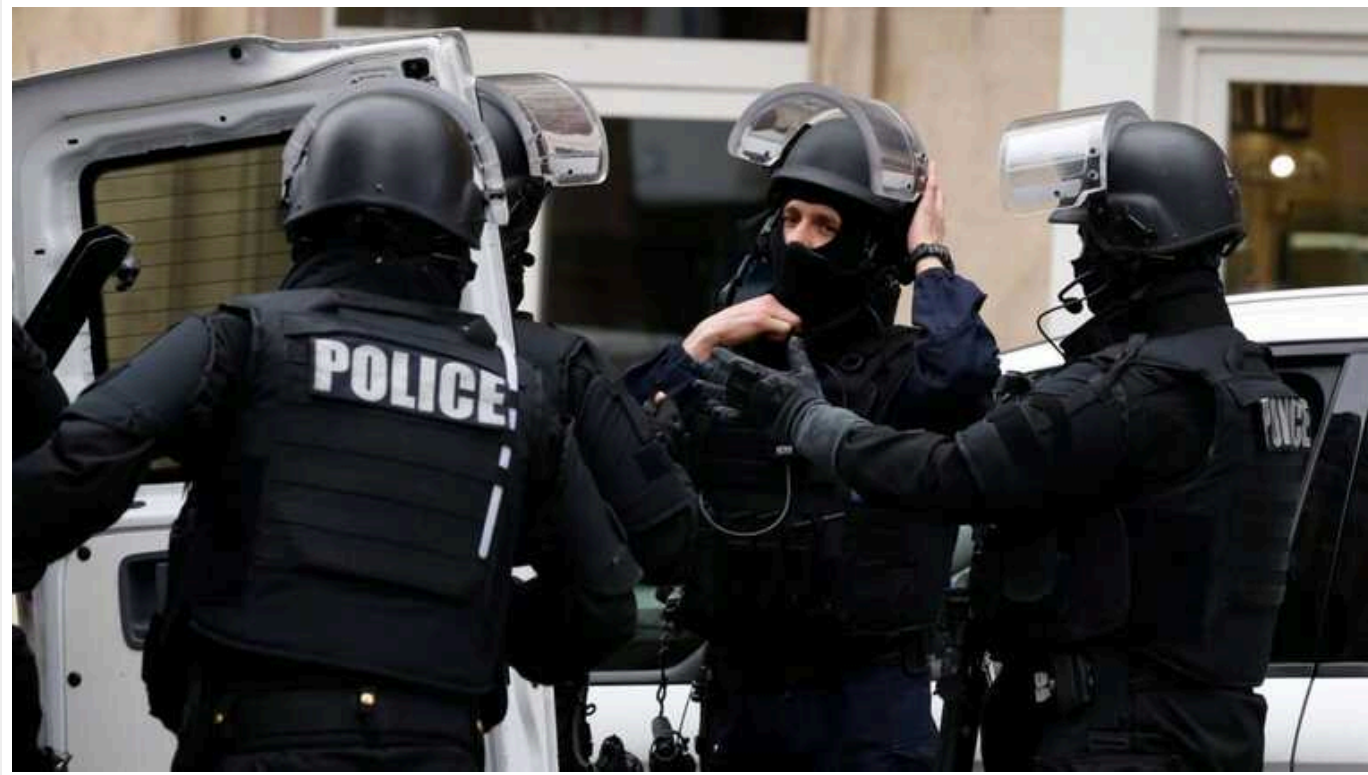
Під час Олімпіади в Парижі французькі правоохоронці зірвали три спроби терактів

Французькі правоохоронці заявили, що запобігли трьом спробам терактів у Парижі та інших містах під час проведення Олімпійських та Паралімпійських ігор.