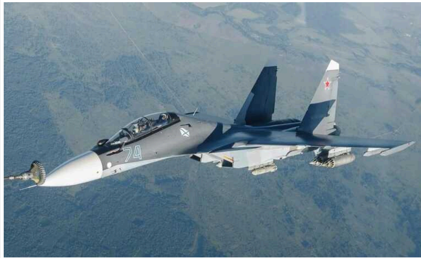
Зникнення російського Су-30 поблизу Криму: в мережі пишуть про можливу катастрофу

Минулої ночі неподалік Севастополя зник російський винищувач Су-30СМ. Імовірно, військовий літак зазнав аварії.