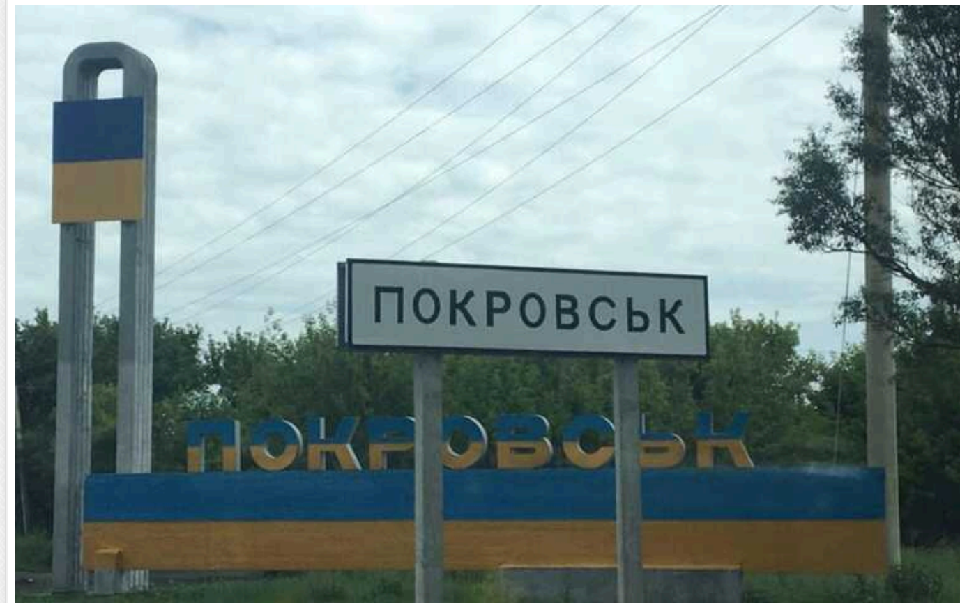
Бої за Покровськ: цілком можливо, доведеться відступити з деяких позицій

Протягом останнього тижня росіяни не досягли прогресу в напрямку Покровська. Однак це не свідчить про те, що російській наступ призупинено. Трохи південніше міста, на Курахівському напрямку, ситуація вкрай складна.