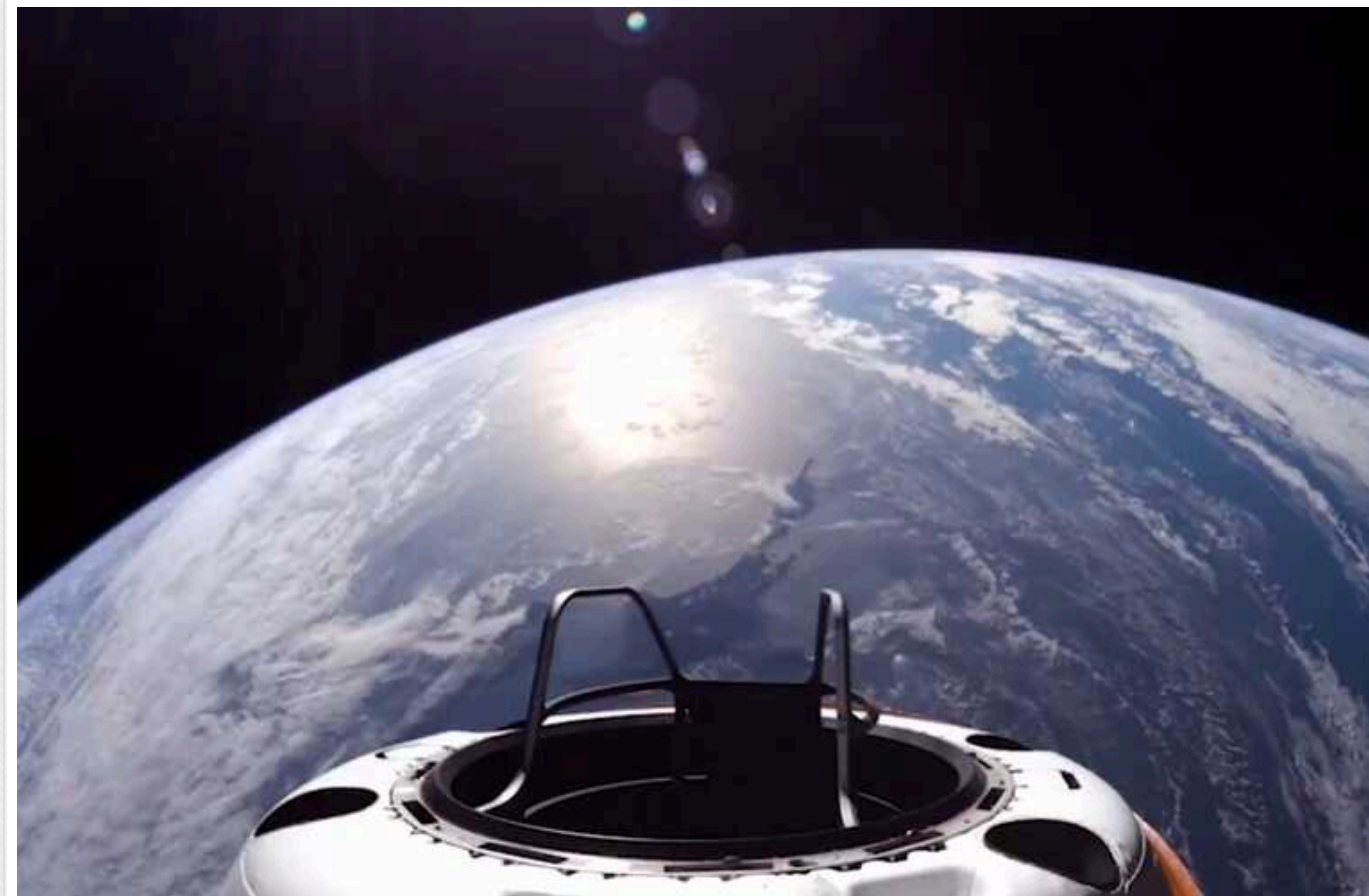
Корабель SpaceX, запущений вчора з космічними туристами, досяг рекордної висоти - 1400 кілометрів над Землею

Востаннє люди піднімалися на таку висоту 50 років тому, під час місії «Аполлона».