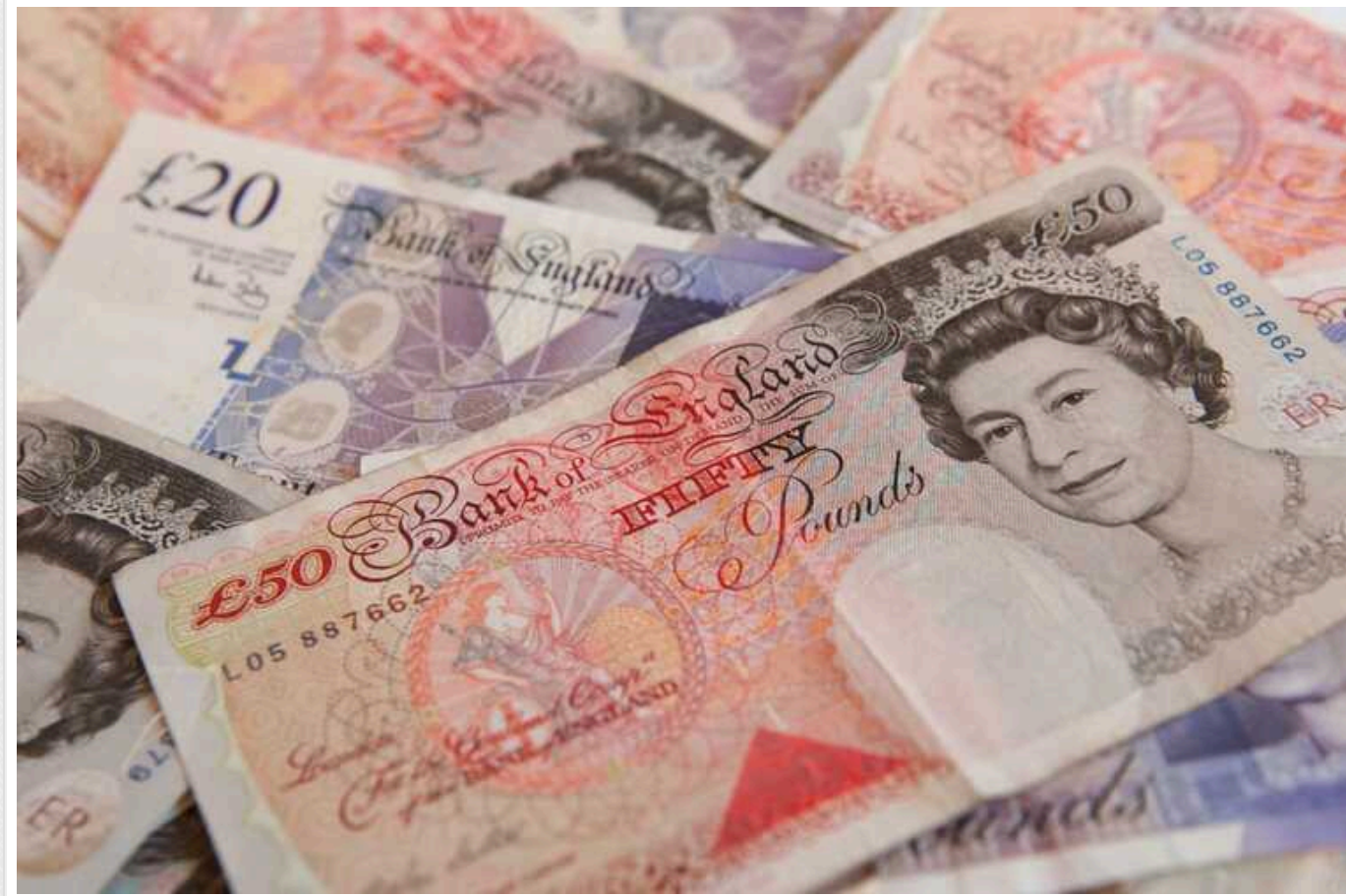
Податкове шахрайство: як малий бізнес у Британії ухиляється від сплати ПДВ та інших зборів

Ухилення від сплати податків серед малого бізнесу у Великій Британії зросло до 4,4 млрд фунтів стерлінгів у 2022-2023 роках, що становить 81% від загальної суми.