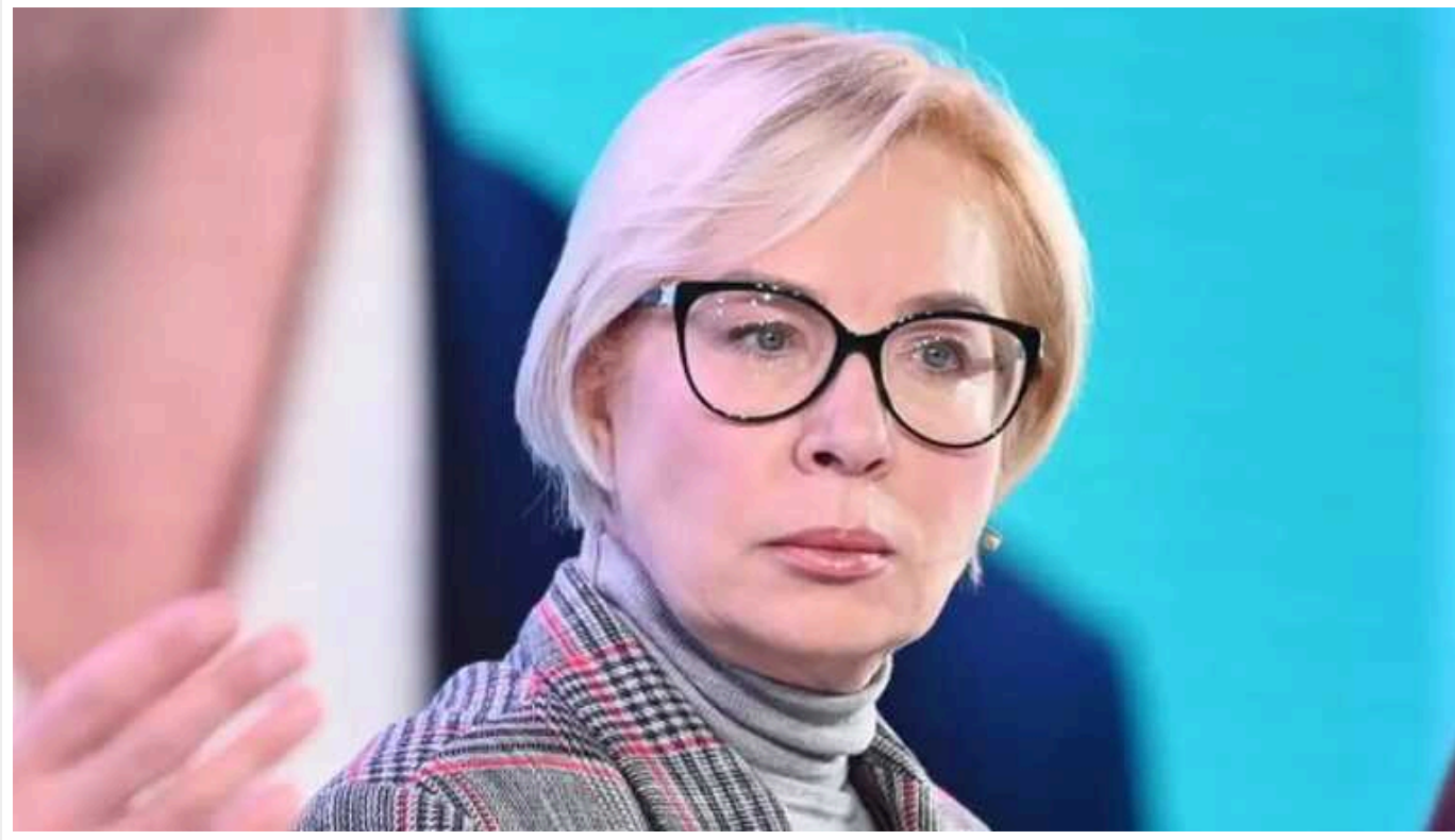
У колишнього омбудсмена Людмили Денісової знайшли ознаки незаконного збагачення на 9,85 мільйона гривень

В ексімбудсмена, керівниці Українського центру захисту прав людини та членкині правління Пенсійного фонду України Людмили Денісової знайшли ознаки неостовірного декларування на 20 млн гривень та незаконного збагачення на 9,85 млн гривень.