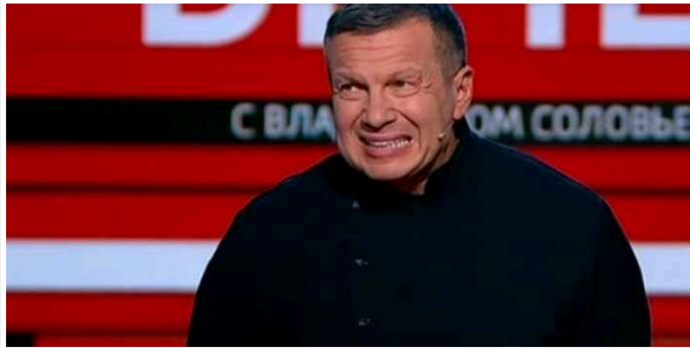
Пропагандист Соловйов розчарувався в російській ППО й дорікнув військовим за брехню

Нездатність Міноборони РФ захистити повітряний простір країни від атак безпілотників викликає розчарування навіть у найпопулярніших російських медійних осіб.