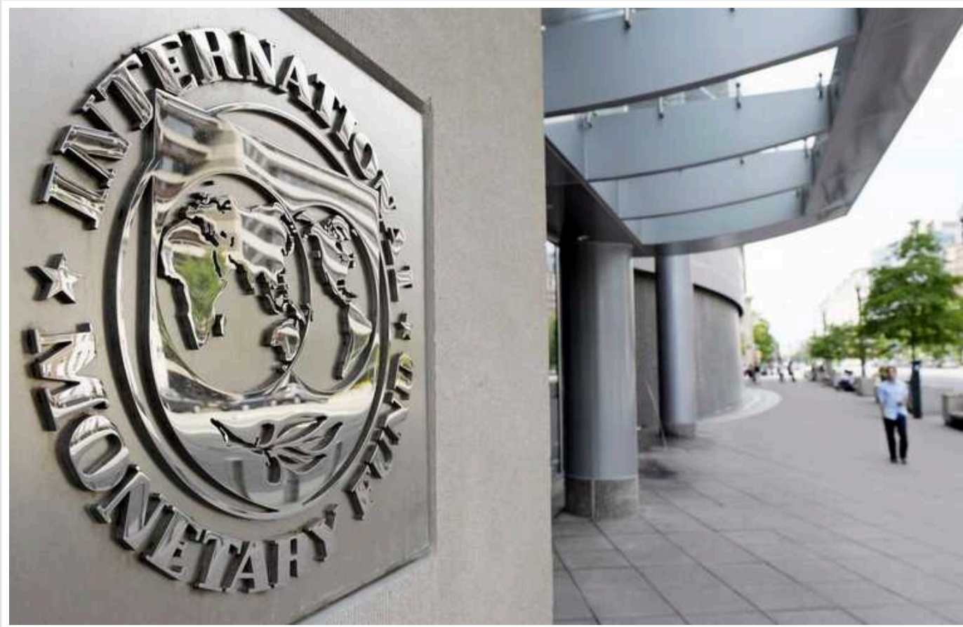
МВФ запропонував Україні підвищити ПДВ, - ЗМІ

Міжнародний валютний фонд пропонує збільшити податок на додану вартість (ПДВ) в Україні на 2 процентних пункти. Це питання обговорювалось під час роботи Фонду в Києві.