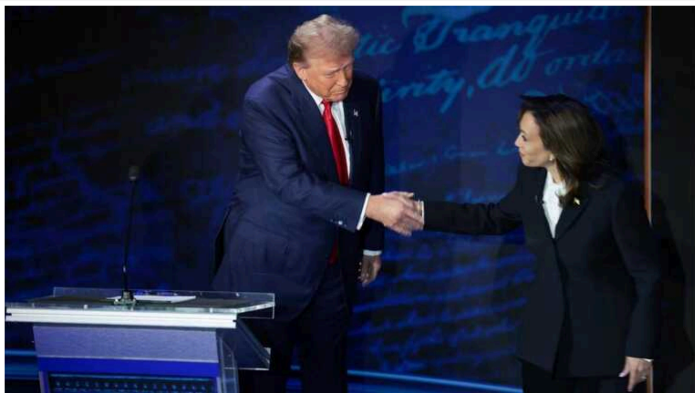
Камала Гарріс виграла дебати, – ЗМІ

За результатами опитування CNN Гарріс перемаєє Трампа у дебатах на думку 63% глядачів.