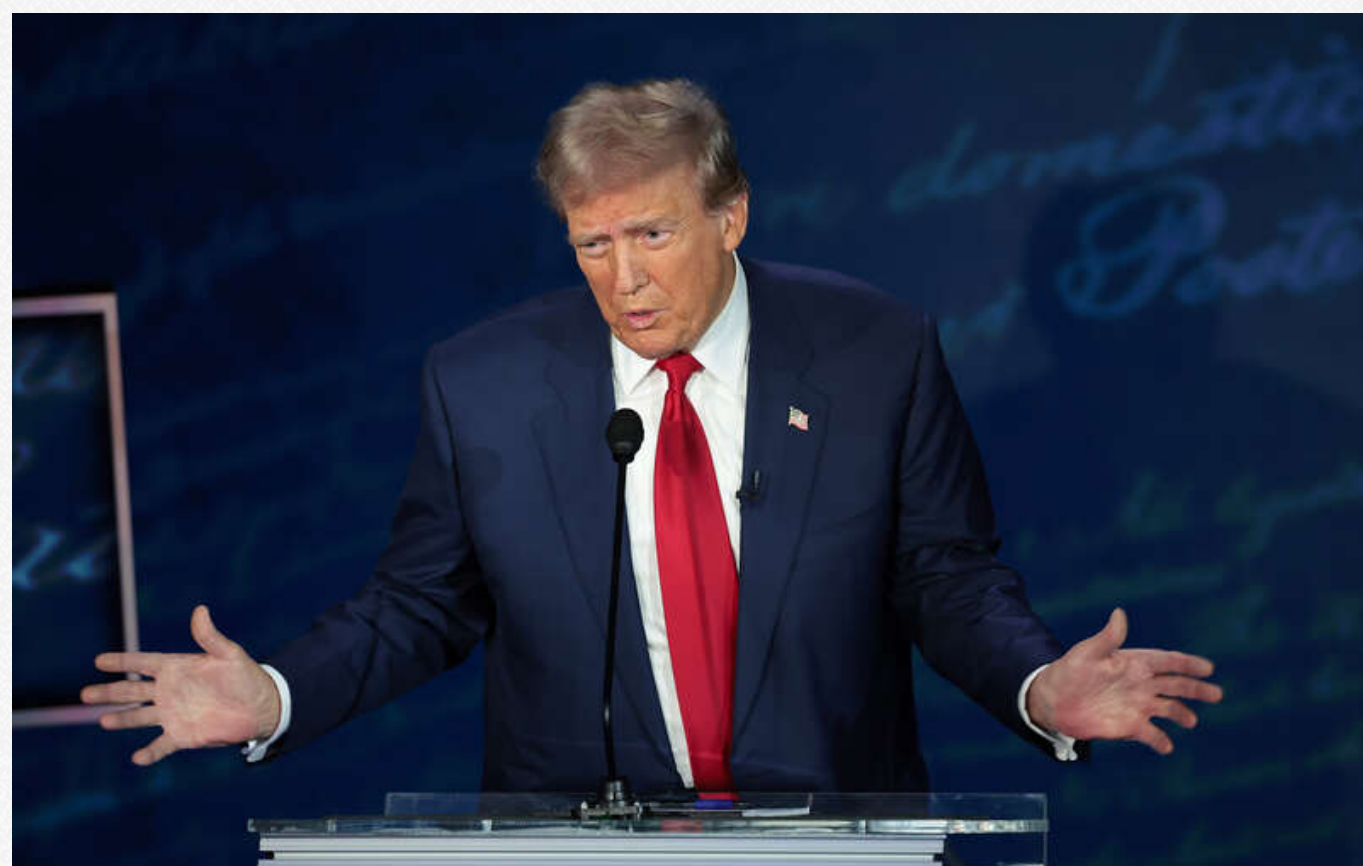
Фото: Трамп висловлює Орбана на дебатах

"Дивіться, це сказав Віктор Орбан. Він сказав, що людиною, яку найбільше поважають і якої найбільше бояться, є Дональд Трамп", – додав він, а також назвавORBана "одним з найшановніших людей"