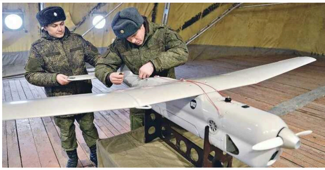
В РФ показали ШІ-безпілотнок «Штурм» для ЗС РФ

“Царські вовки” заявляють, що безпілотний комплекс є “інтелектуальним” і має стійкість до засобів радіоелектронної боротьби.