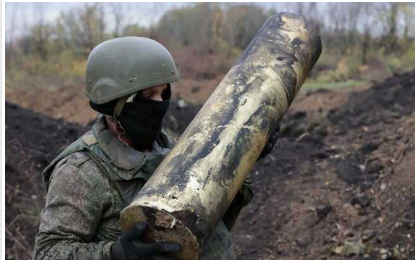
Окупанти хочуть підійти максимально близько до Харкова, – ЗСУ