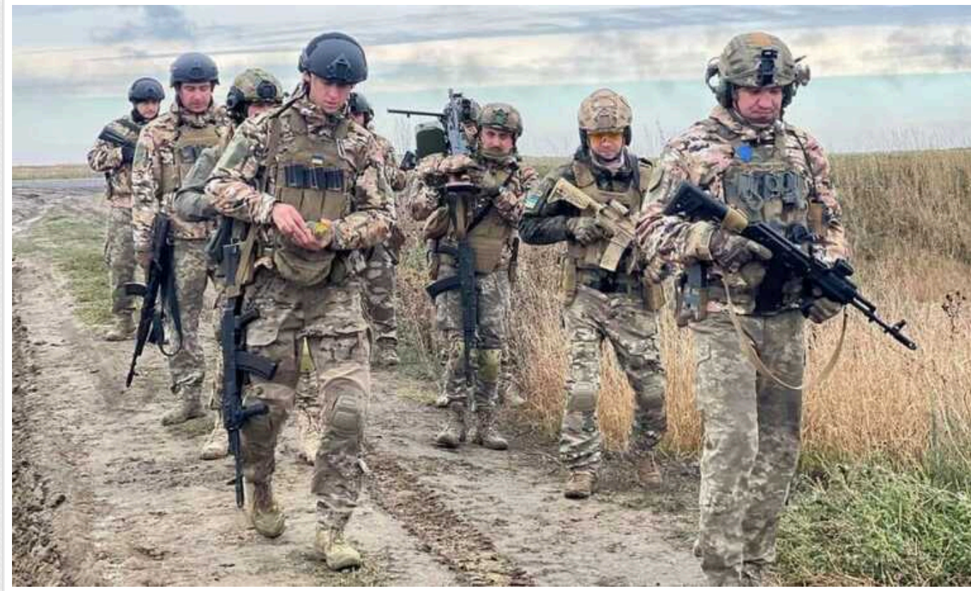
Окупанти вдарили по скупченню ЗСУ у Сумській області: в DeepState підтвердили

DeepState підтвердив автентичність відео удару по скупченню солдат ЗСУ біля Бездрика в Сумській області.