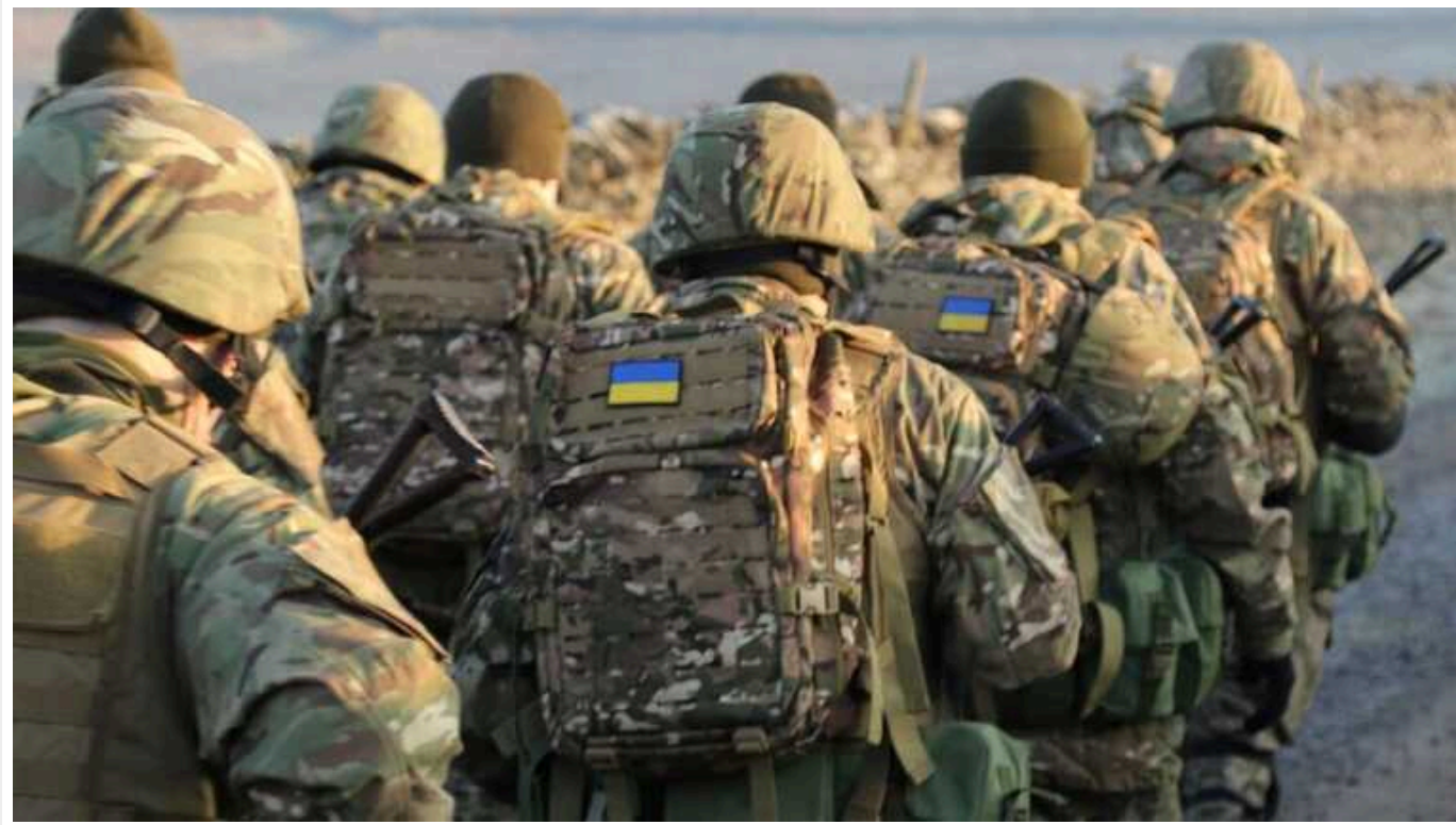
Ситуація на фронті: РФ активізувалась ще на трьох напрямках фронту, тривають бої в районі Лозової

Навечір 10 вересня російські сили активізувалися на Куп'янському, Лиманському та Торецькому напрямках. З початку доби сталося 112 бойових зіткнень.