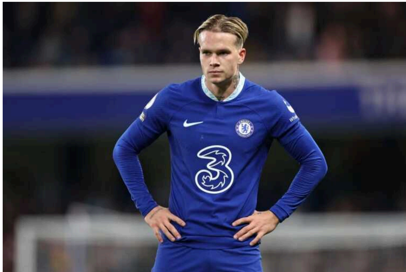
"Челсі" ухвалив кардинальне рішення щодо Михайла Мудрика

Лондонський клуб "Челсі" збирається під час зимового трансферного вікна відправити українського півзахисника Михайла Мудрика в оренду, повідомляє thechelseachronicle.com з посиланням на журналіста Саймона Філіпса. На думку інсайдера, нові агенти 23-річного футболіста збірної України хочуть вибити йому більше ігрового часу, що повернути кар'єру в потрібне русло.