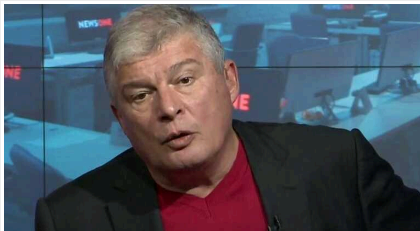
Євген Червоненко намагається уникнути відповідальності за керування авто у нетверезому стані: справу передали до суду

Колишній міністр транспорту та зв'язку України Євген Червоненко, який славиться своїми антиукраїнськими висловлюваннями, намагається уникнути відповідальності за керування автомобілем у нетверезому стані. Справу проти нього наразі передано до суду.