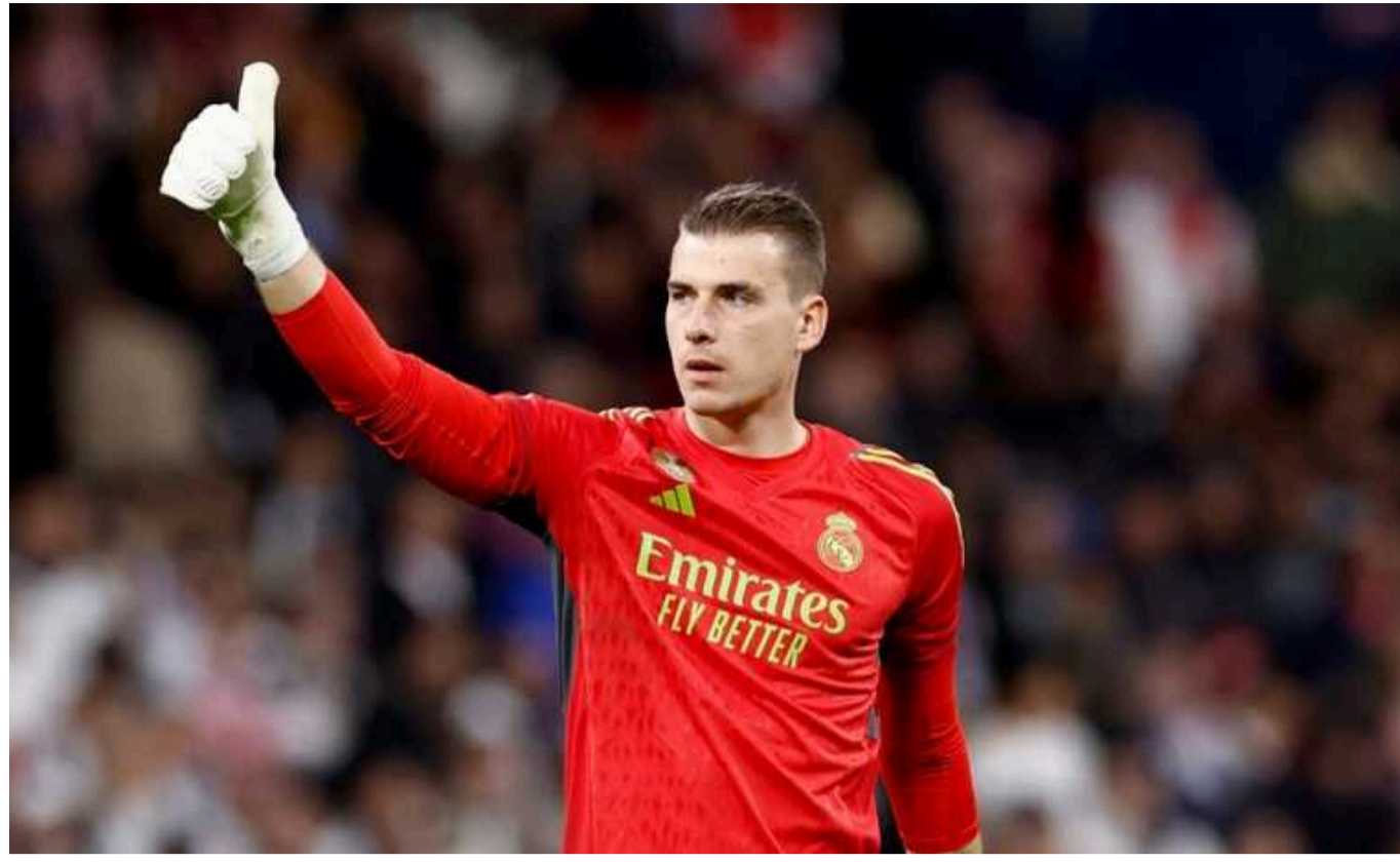
Воротар збірної України Андрій Лунін готує підставу "Реалу"

Воротар мадридського "Реала" Андрій Лунін остаточно вирішив не подовжувати контракт із клубом і залишити його наступного літа на правах вільного агента. Крім того, українець готовий буквально шокувати керівництво та вболівальників "галактикос", перейшовши до "Атлетико".