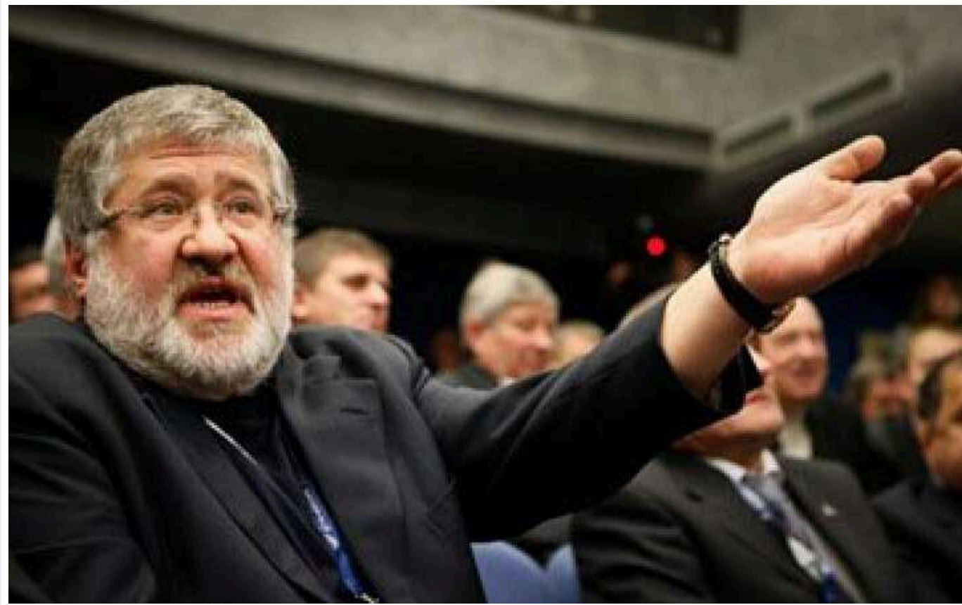
Апеляційний суд підтвердив неможливість повернення "ПриватБанку" Ігорю Коломойському

Північний апеляційний господарський суд міста Києва підтвердив неможливість повернення державного "ПриватБанку" колишнім власникам, заклавши провадження за позовом колишніх акціонерів "ПриватБанку" Ігоря Коломойського та кіпрської компанії Triantal Investments Ltd.