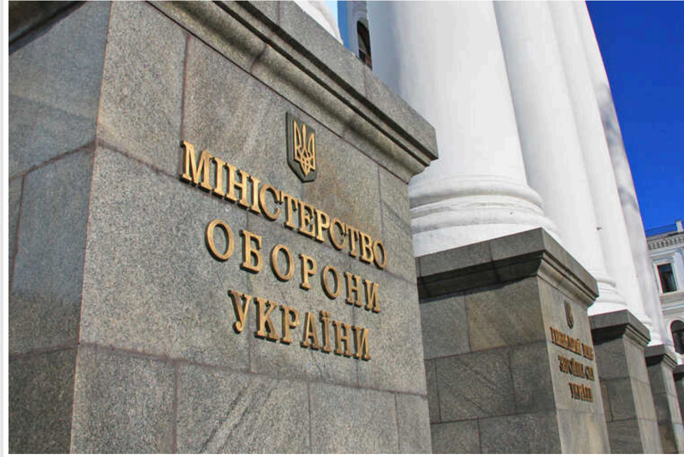
У Міністерстві оборони можуть відбутися перестановки - через корупцію та провали на фронті

Українські генерали за останні кілька тижнів зіткнулися з величезним валом критики на свою адресу.