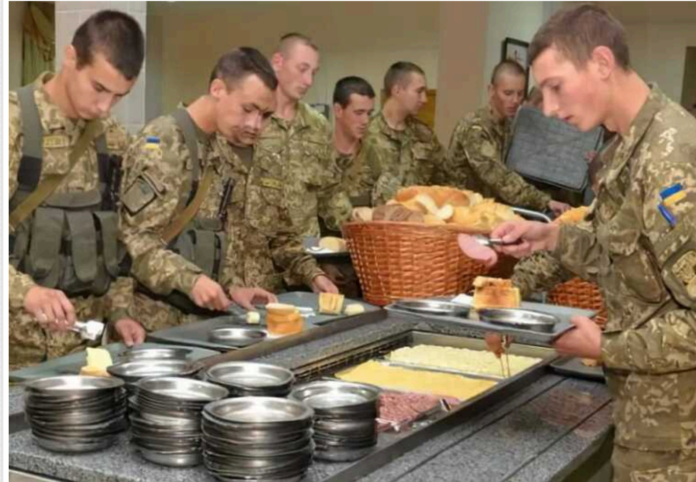
ЗСУ починають використовувати нову модель забезпечення харчування для своїх бійців, – Міноборони

Періодично з'являються дані про постачання неналежних продуктів військовослужбовцям. Нова система створить додаткові механізми контролю якості, а також забезпечить безперервність поставок.