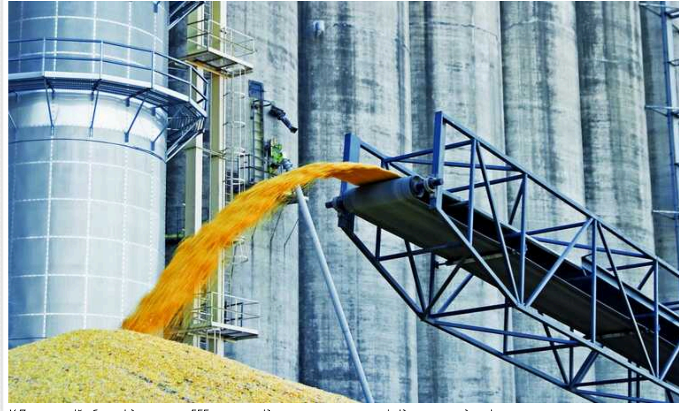
У Полтавській області детективи БЕБ викрили підприємство на ухиленні від сплати податків

Збитки завдані державі у сумі 4,8 млн грн відшкодовано у повному обсязі.