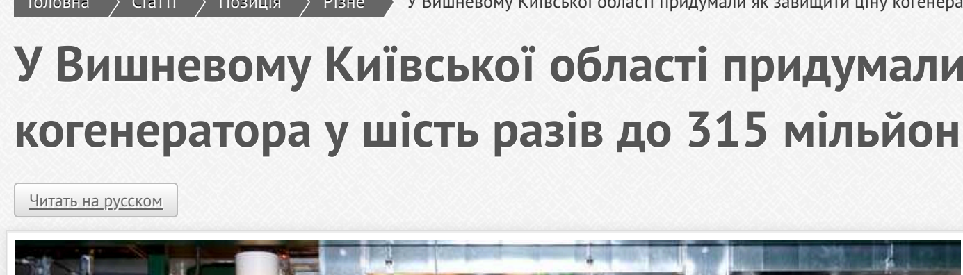
У Вишевому Київській області придумали як завищити ціну когенератора у шість разів до 315 мільйонів

Минулого тижня найбільші тендери в Україні були присвячені важливим потребам – закупівлі газових генераторів електроенергії та тепла, які знадобляться вже цієї зими. Коли у нас у 100-відсотковою імовірністю будуть відключені світла, ці когенератори дозволять організувати точкову подачу енергії.