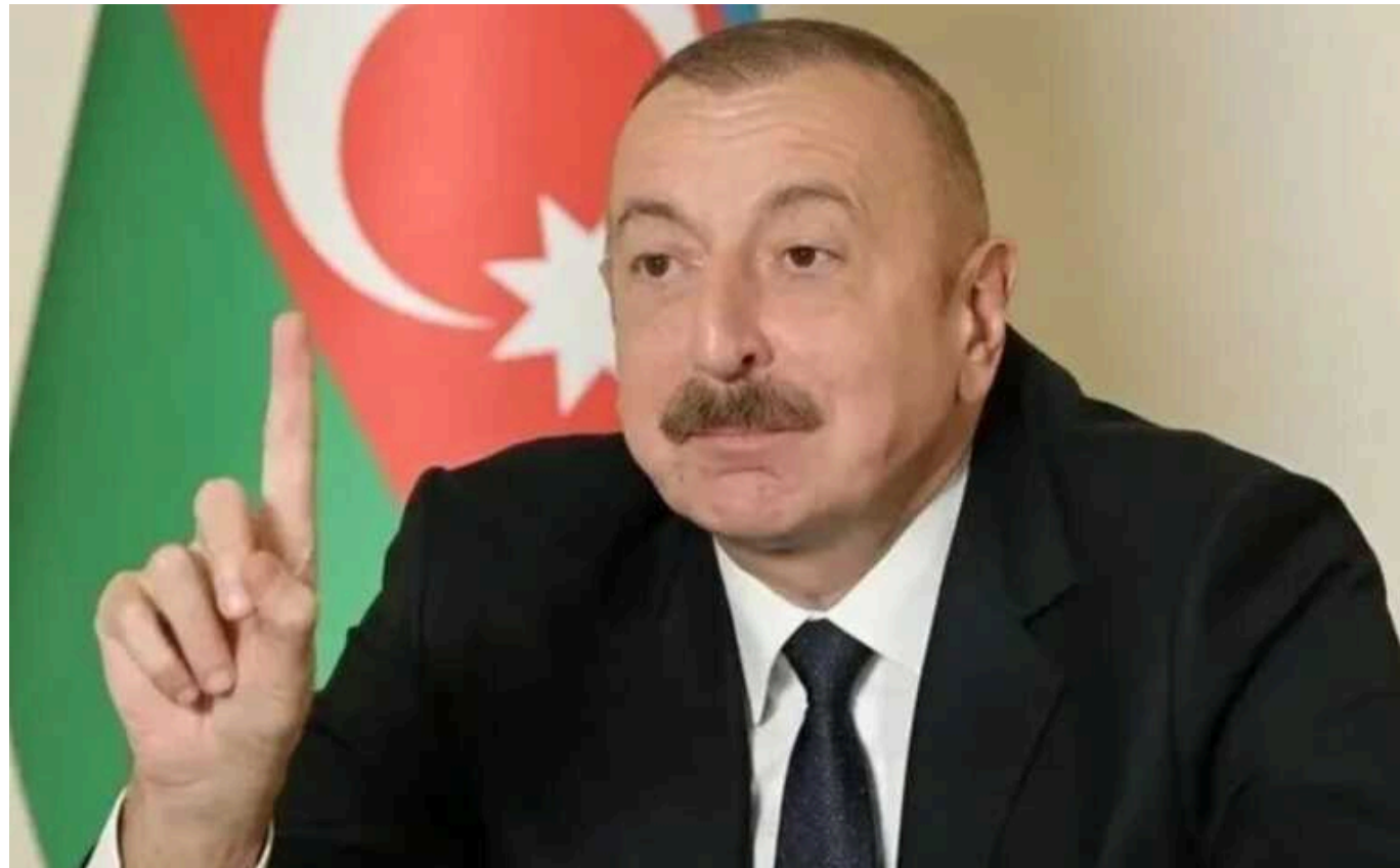
Алієв висловив думку, що без Азербайджану Київ зіштовхнеться із серйозними проблемами

Протягом останніх кількох місяців ведуться переговори про поставки азербайджанського газу в Європу через Росію та Україну.