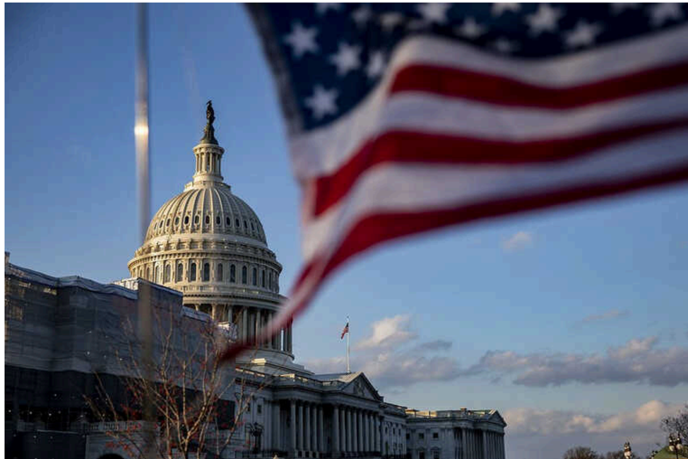
Білий дім передав Конгресу засекречену доповідь про свою стратегію щодо війни в Україні, – Reuters

Адміністрація Джо Байдена нібито надіслала до Конгресу довгоочікувану засекречену доповідь, в якій пояснює свою стратегію стосовно російсько-української війни.