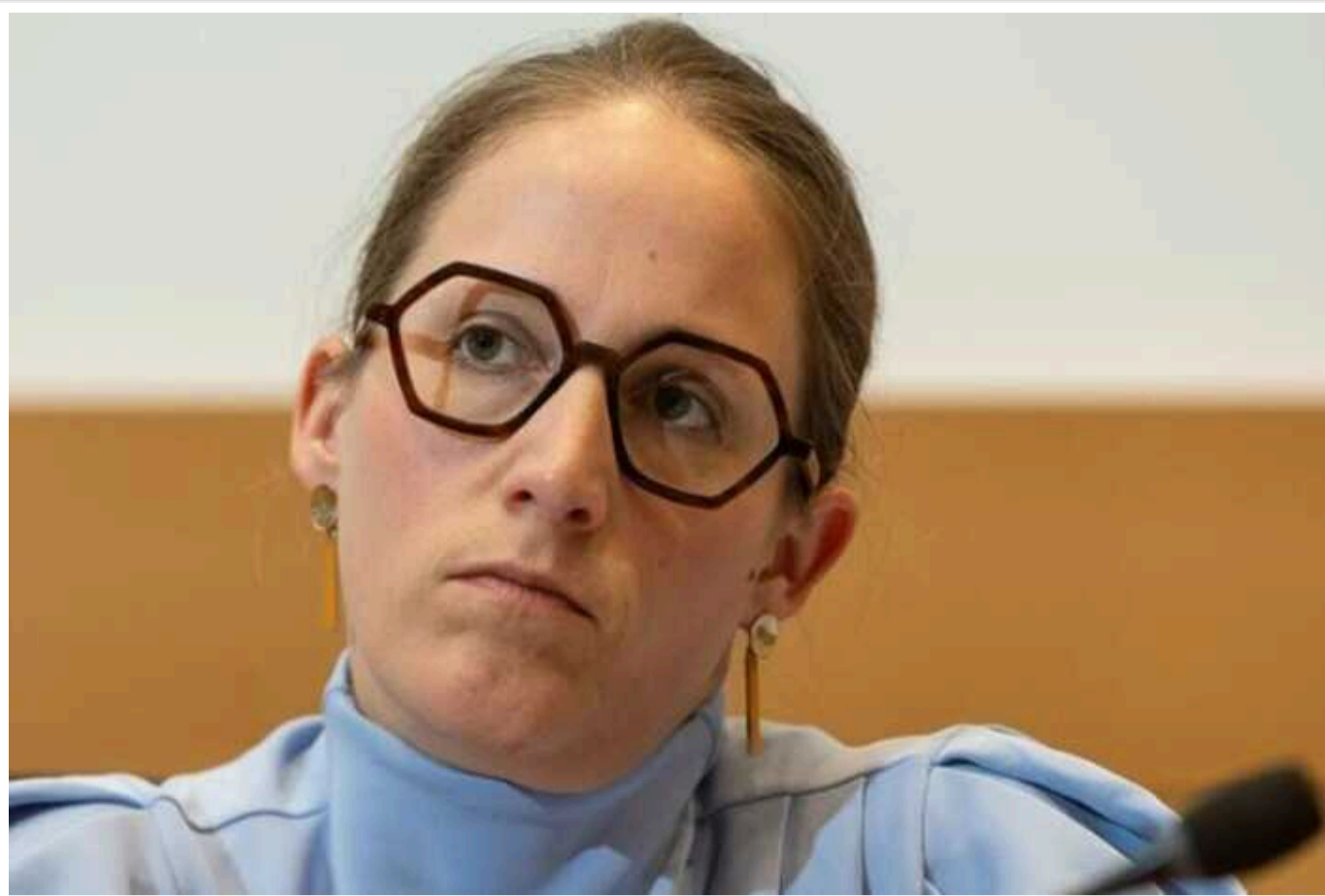
У Бельгії розкритикували Орбана за його погрози "відправляти мігрантів до Брюсселя"

Державна секретарка Бельгії з питань притулку та міграції Ніколь де Мур висловила обурення нещодавніми заявами угорського уряду стосовно транспортування біженців до Брюсселя.