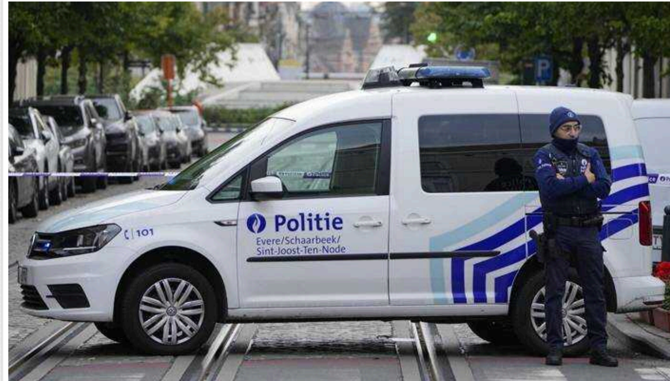
У Бельгії засудили до 15 років вихідця з Чечні за підготовку теракту

Суд бельгійського міста Брюгге засудив вихідця з Чечні до 15 років в'язниці за ряд терористичних злочинів, а також визнав винними його родичів.