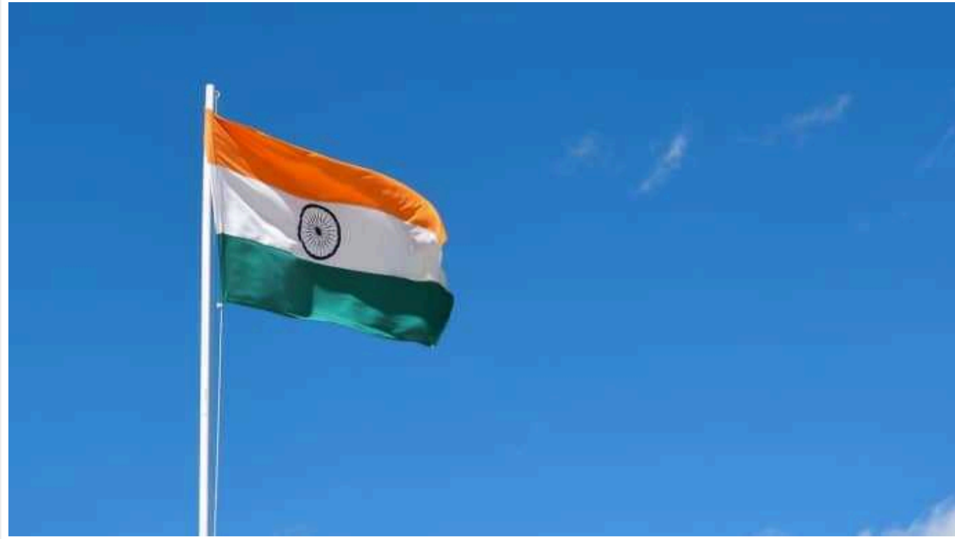
Індія вирішила виступити посередником у завершенні війни Росії з Україною

Прем'єр Індії Нарендра Моді вирішив спробувати виконати обіцянку, яку дав під час візиту до Києва, – допомогти «як другу» принести мир в Україну.