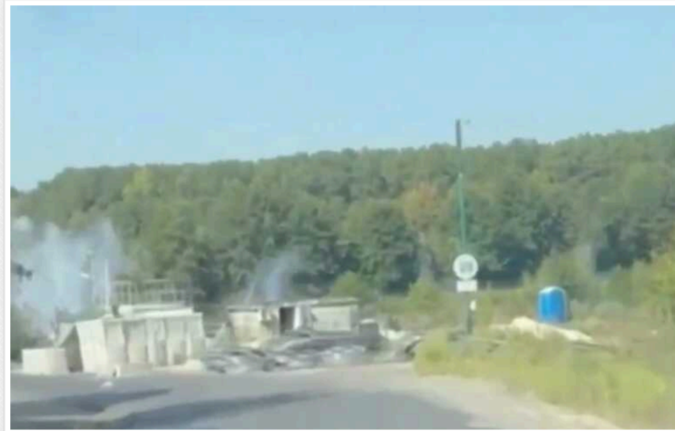
У мережі публікують кадри обстрілу мосту через Сейм у Курській області