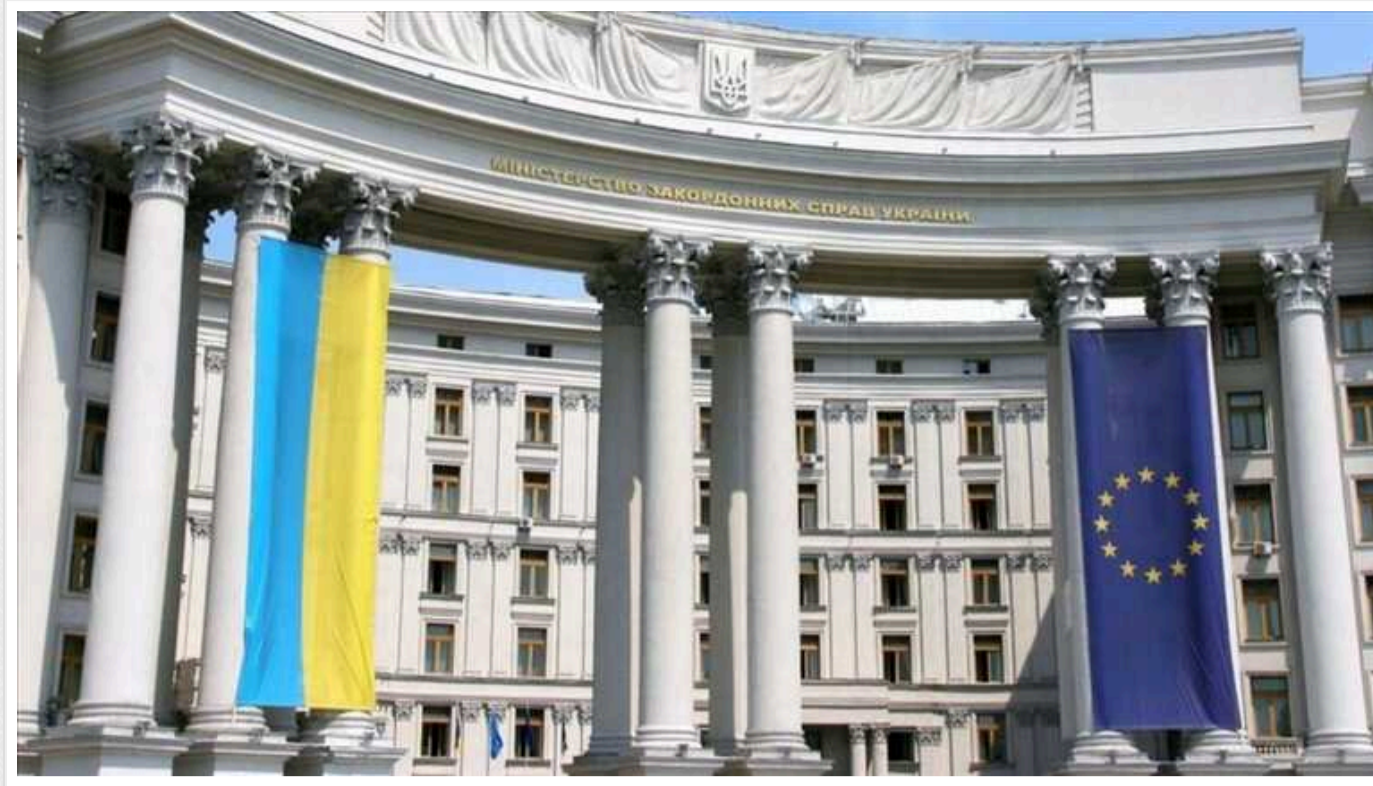
МЗС України викликала тимчасового повіреного Ірану та попередили про наслідки надання РФ ракет