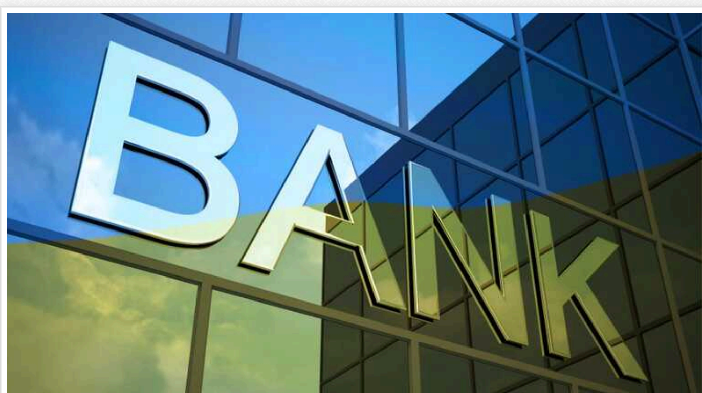
Банки для підтвердження доходу українців можуть почати активно запитувати у них довідки про зарплату та податкові декларації

Нацбанк України став причиною нового скандалу щодо платежів громадян та фінансового моніторингу.