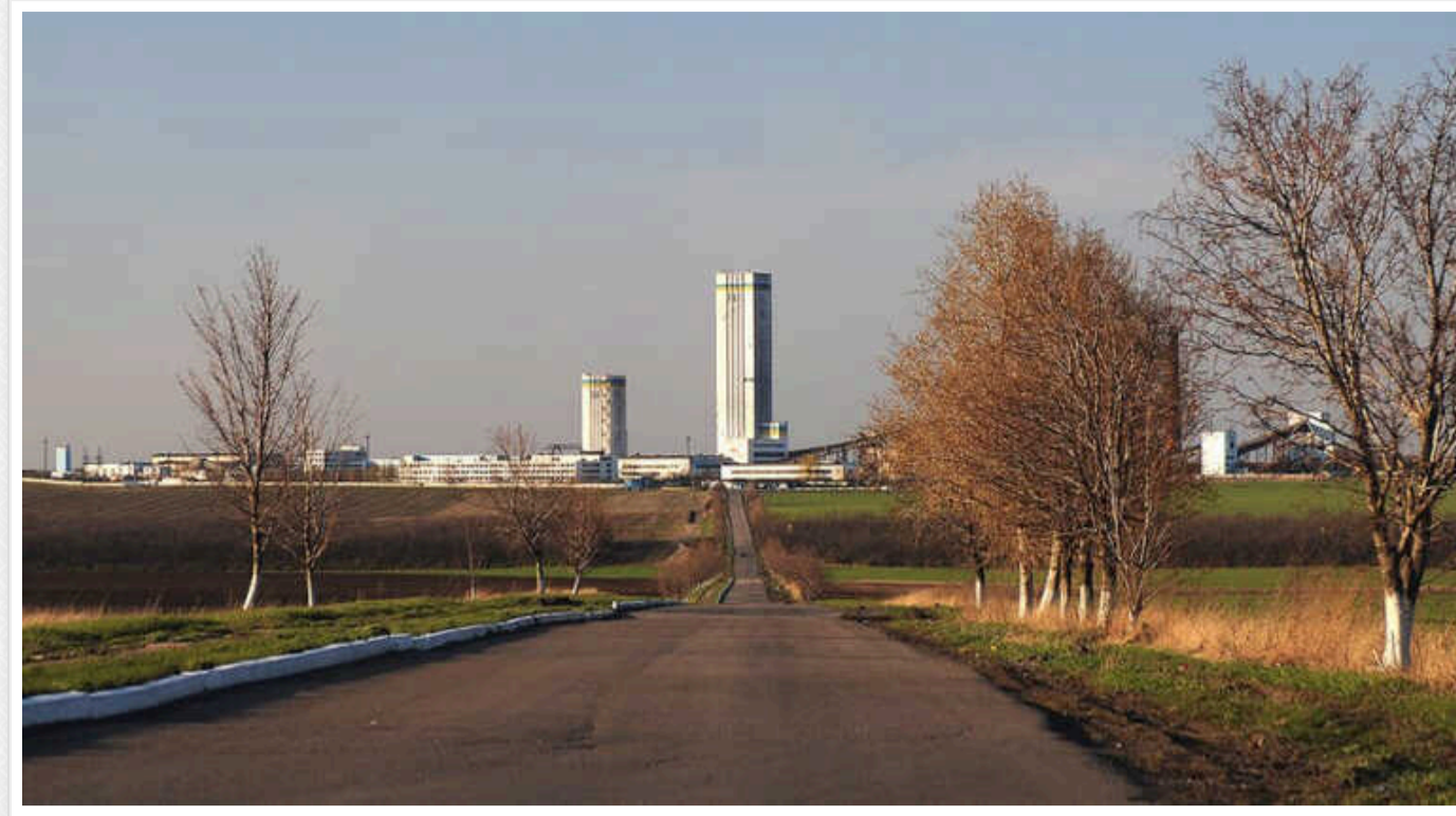
Після захоплення Водяного на Донеччині ЗС РФ мають намір із нового напрямку почати штурм шахти «Південнодонбаська №3», - DeepState

Крім того, DeepState публікує фотографії російських солдатів на північно-західній околиці Водяного.