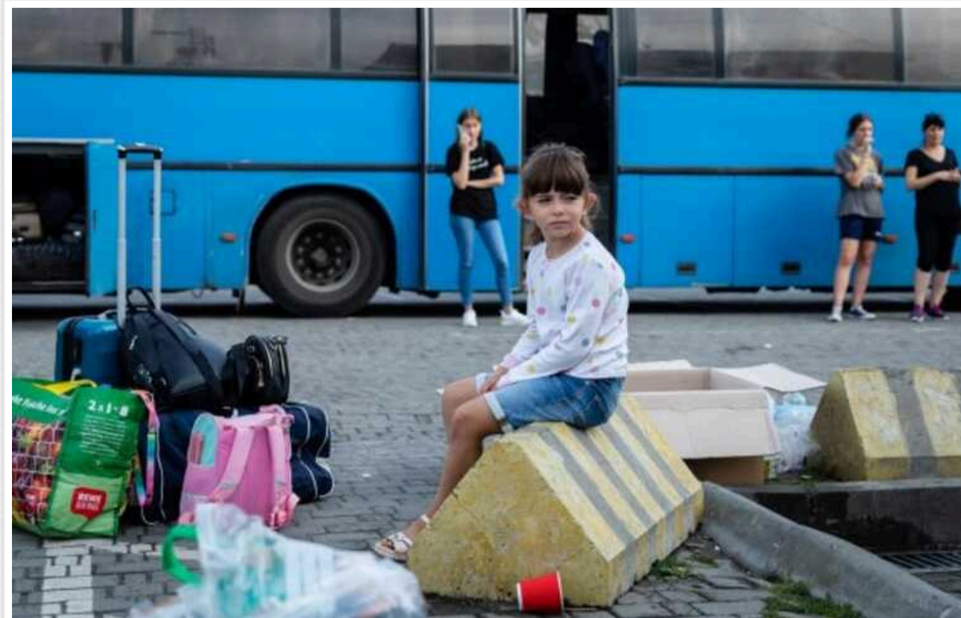
У Сумській області оголосили примусову евакуацію ще з трьох населених пунктів

Влада Сумської області оголосила про примусову евакуацію в низці населених пунктів. Загалом там мешкає близько 40 тисяч осіб.