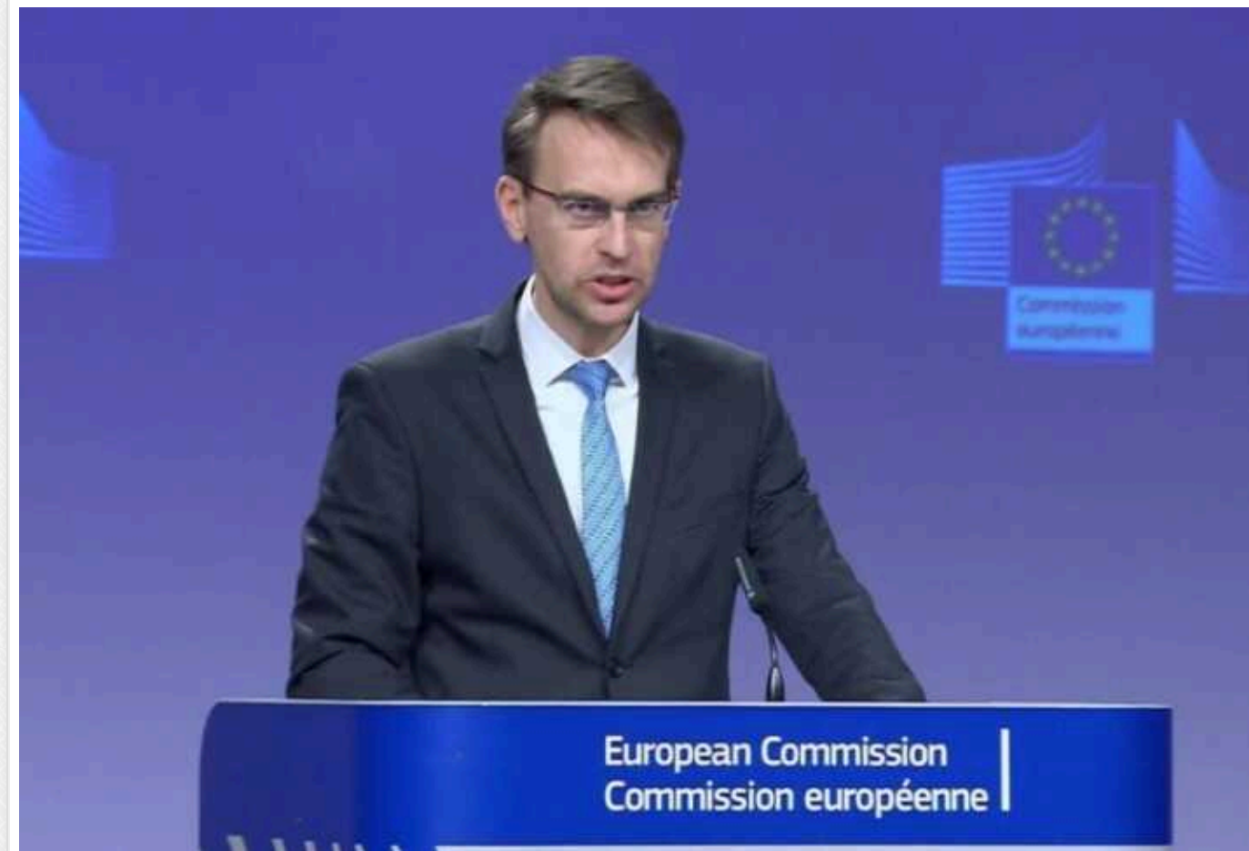
В ЄС підтвердили передачу Іраном балістичних ракет Росії та пообіцяли пришвидшену відповідь

Керівництво Європейського Союзу отримало «достовірні відомості» про те, що Іран здійснив постачання балістичних ракет до РФ.