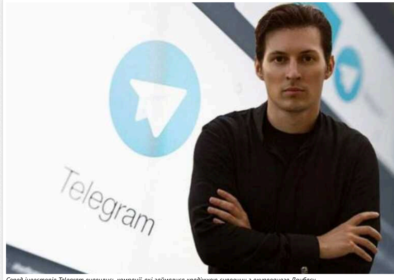
Серед інвесторів Telegram виявились компанії, які займалися крадіжкою сировини з окупованого Донбасу

Багато з них пов'язано з олігархом-утікачем Сергієм Курченком.