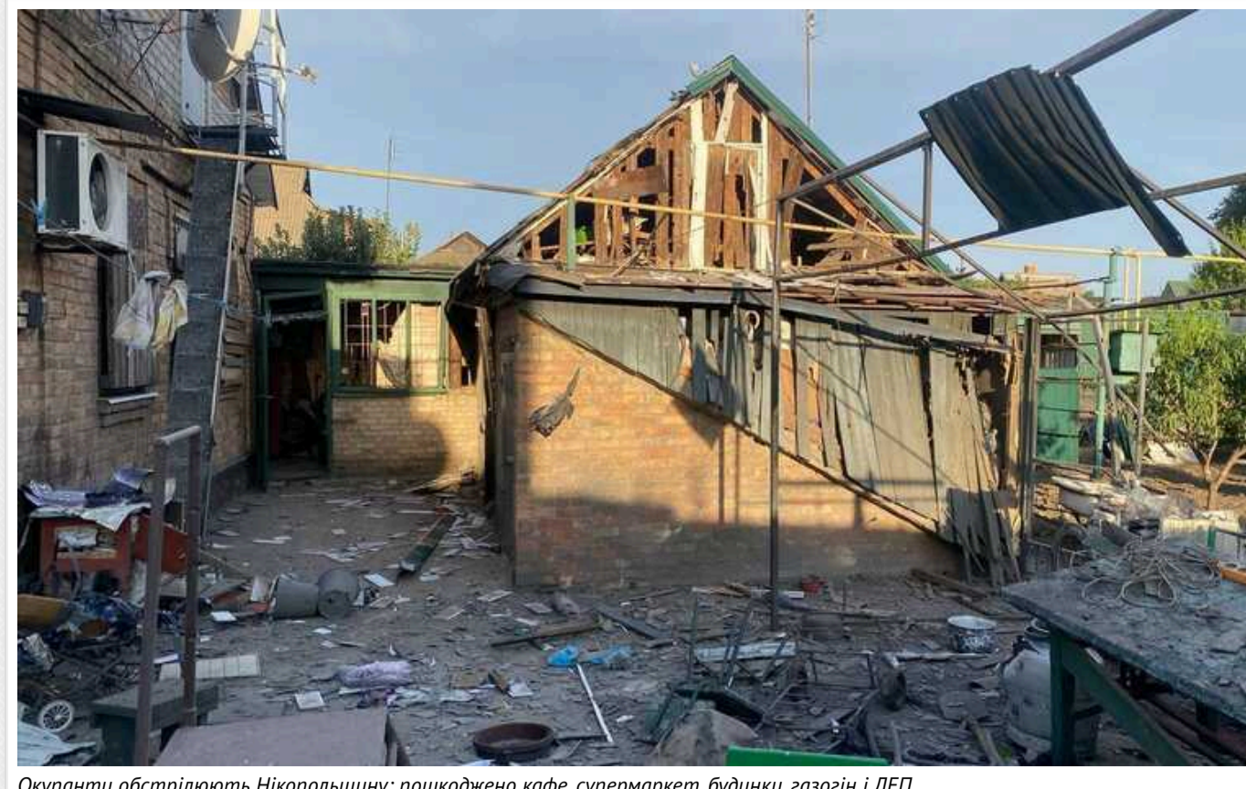
Окупанти обстрілюють Нікопольщину: пошкоджено кафе, супермаркет, будинки, газогін і ЛЕП

Країна-агресорка продовжує тероризувати Дніпропетровщину з тимчасово захоплених територій. Цього разу під ворожою атакою знову опинилася Нікопольщина.