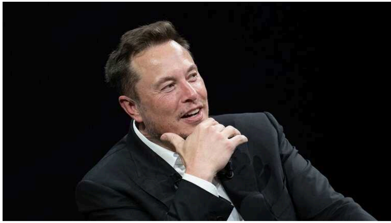
Ілон Маск хоче стати першим трильйонером

Ілон Маск має на меті стати першим трильйонером у світі до 2027 року, – повідомляє академія Informa Connect.