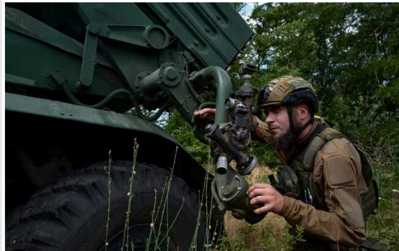
CNN: ЗСУ стикаються з падінням бойового духу та збільшенням випадків дезертирства

Українська армія стикається з падінням морального духу та збільшенням випадків дезертирства, особливо в піхотних підрозділах на сході країни, зокрема під Покровськом. Про це повідомляють українські командири та офіцери, з якими спілкувалася CNN.