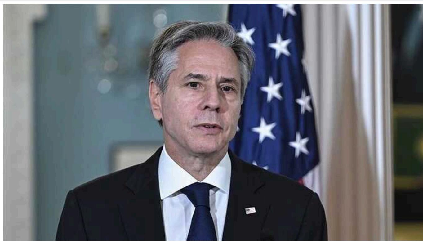
Блінкен найближчим часом відвідає Британію

Державний секретар США Ентоні Блінкен відвідає Велику Британію 9-10 вересня, щоб обговорити з високопосадовцями, зокрема, ситуацію в Україні.