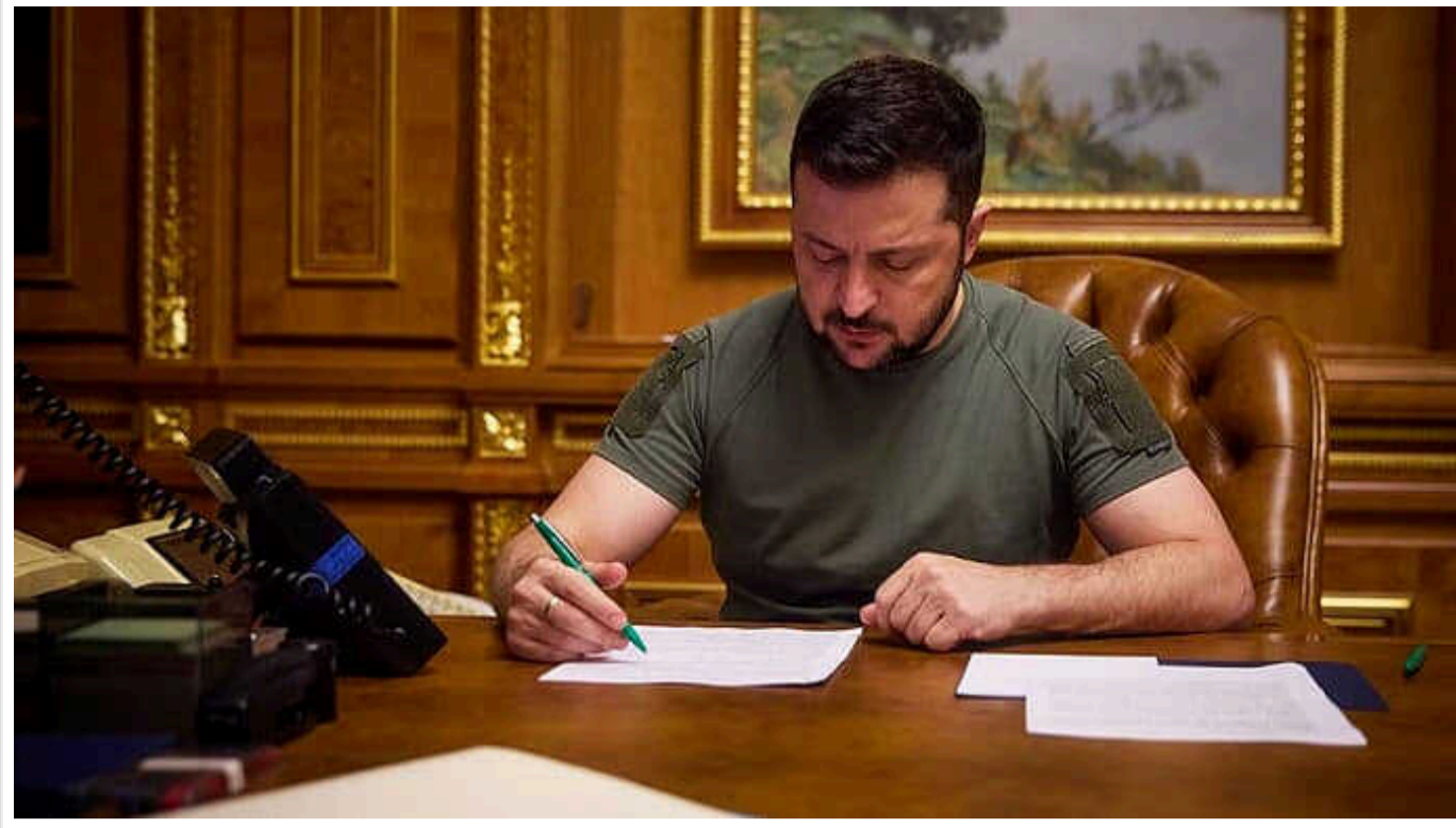
Зеленський провів кадрові перестановки в ОП

Володимир Зеленський провів низку кадрових призначень в Офісі Президента.