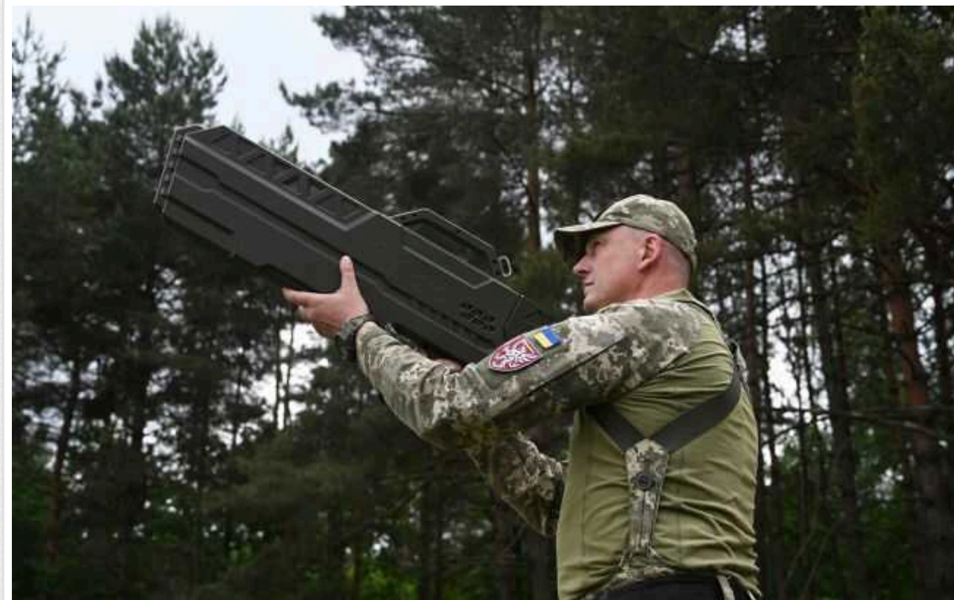
ISW: Україна продовжує успішно адаптувати та розвивати свою РЕБ проти російських дронів

Україна продовжує успішно адаптувати та розвивати свою систему радіоелектронної боротьби (РЕБ) проти дронів Росії, що дозволяє компенсувати тиск на протиповітряну оборону.