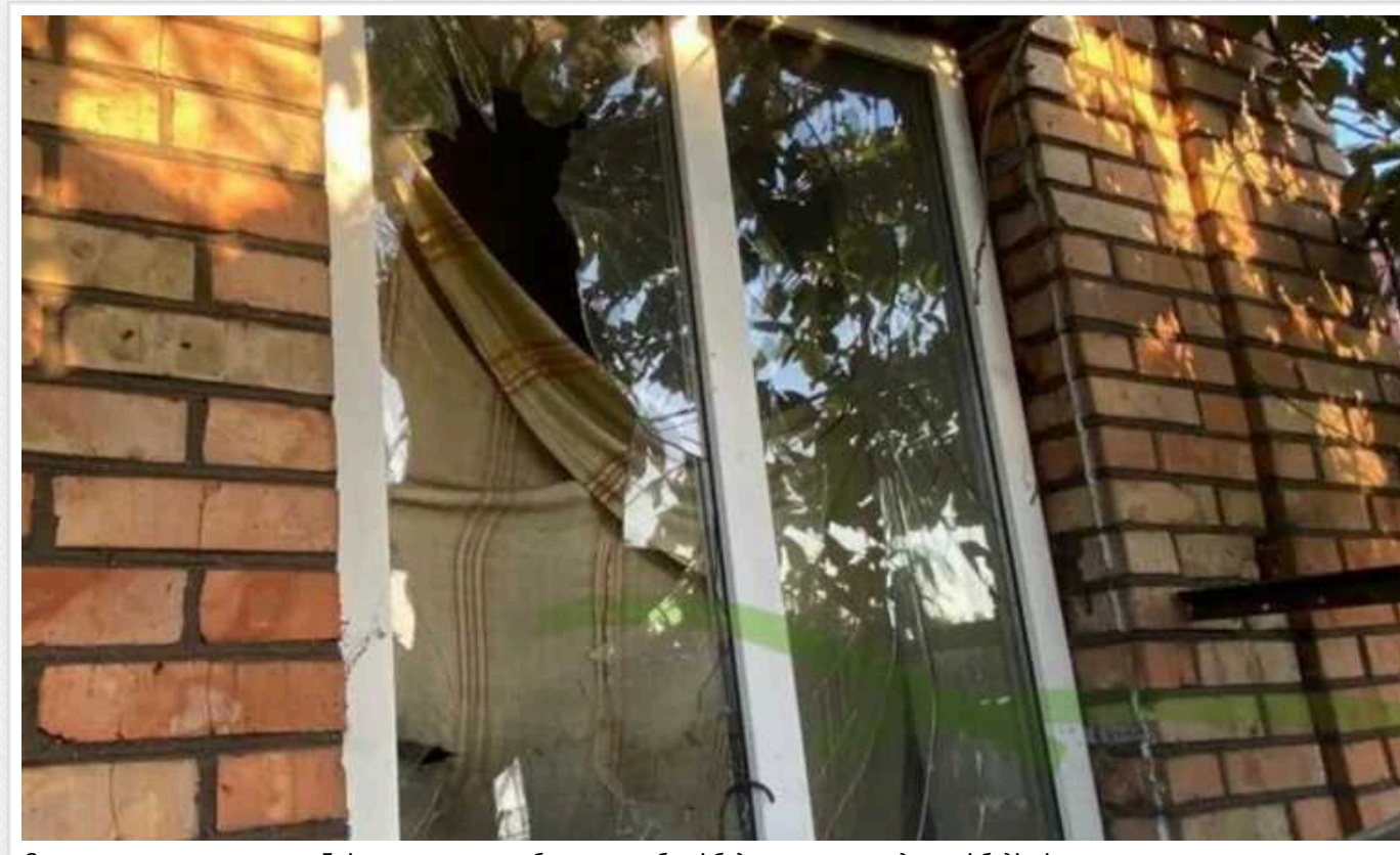
Окупанти знову атакували Дніпропетровську область: розбиті будинки та господарські будівлі

Окупаційна армія РФ продовжує тероризувати територію Дніпропетровської області регулярними обстрілами. Найбільше від атак ворога страждає Нікопольський район.