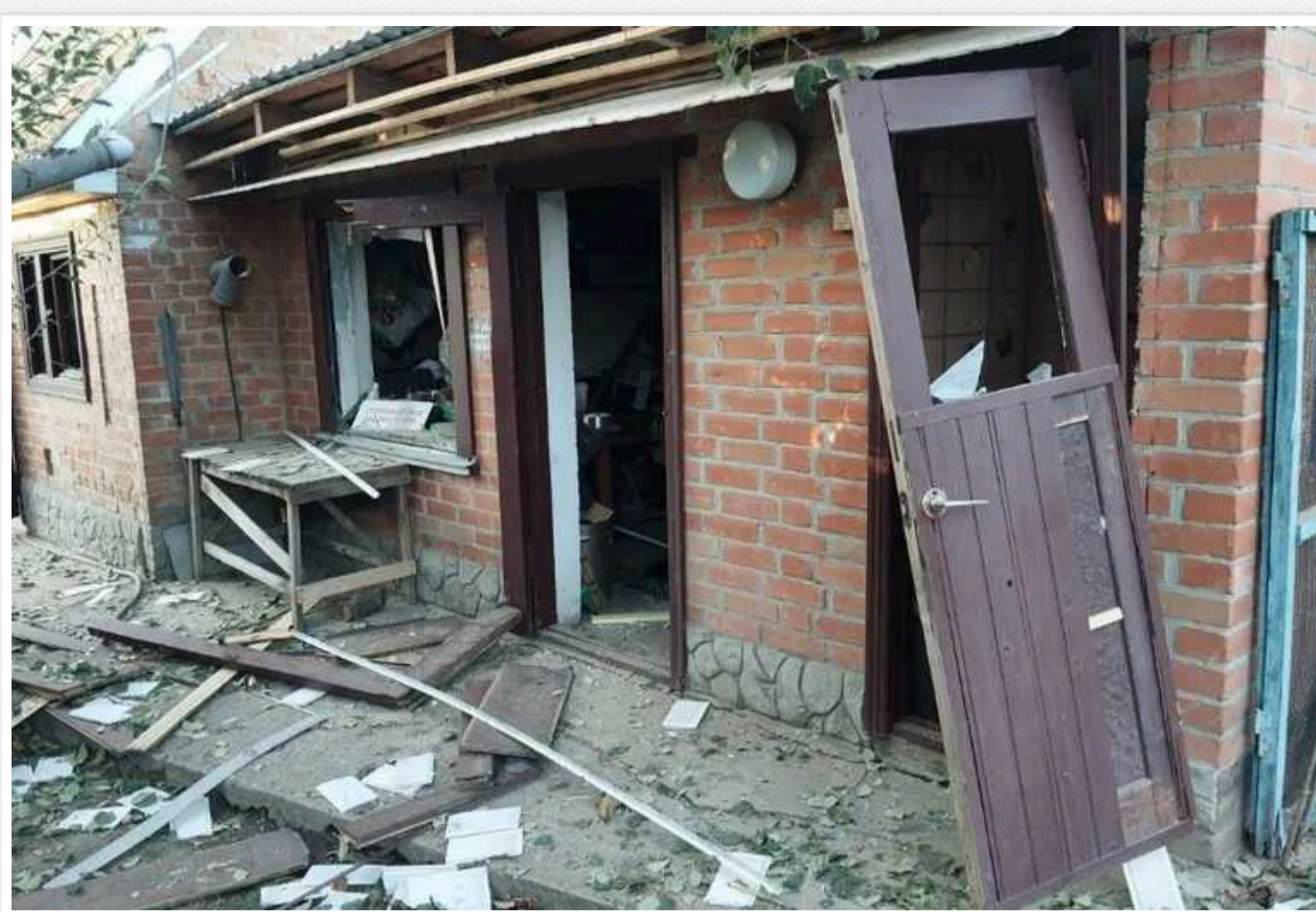
В мережі показали наслідки ударів РФ по цивільних будинках на Полтавщині

У суботу, 7 вересня, російські загарбники вдарили по Полтавській громаді. У мережі оприлюднили наслідки обстрілів.